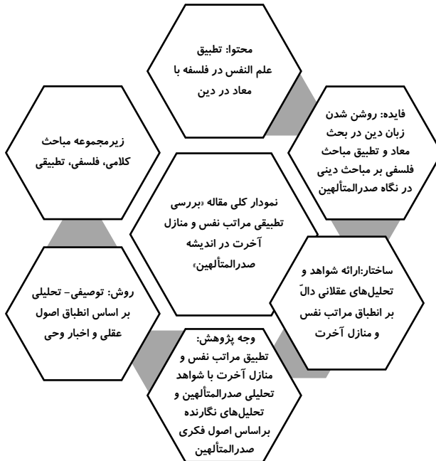
شکل ۱. نمودار کلی مقاله تبیین تأویلی منازل آخرت در مکتب حکمی صدرایی

درباره پیشینه این مقاله باید گفت: نمونه مشابهی از تأویل منازل آخرت با رویکرد صدرایی یافت نشد، گرچه مطالب مذکور در مقاله از کتب منبع اخذ و بدان ارجاع داده شده است.